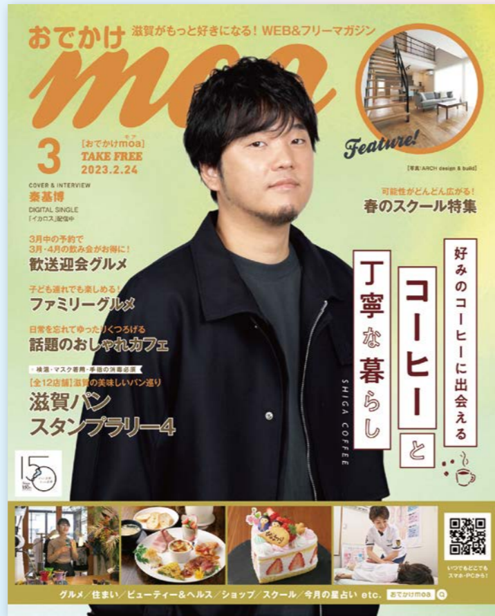
フリーマガジン/電子ブック ※2023年3月号